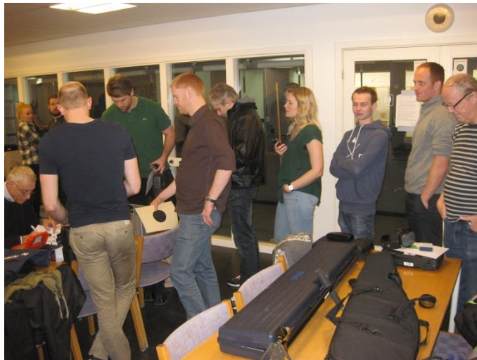
Køen var lang - Mange ville gerne skyde

Endnu en gang blev det i december tid til den traditionsrige juleskydning, som i lige så høj grad handlede om social samvær, gløgg og æbleskiver som at få gode resultater.