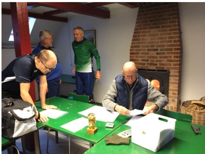
Banelæggeren - Høje Formand - holder styr på resultaterne