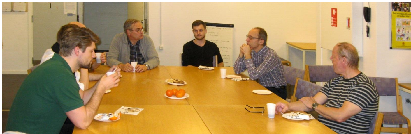
Der spises og hygges