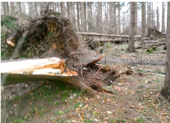
Til gengæld var det mange væltede træer efter stormen "Bodil".