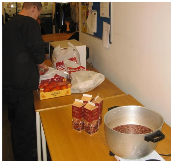
Gløgg og æbleskiver forberedes